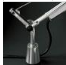
TOLOMEO SUPP.TAVOLO FISSO A004200