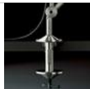
TOLOMEO MORSETTO A004100