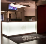
› Dream Hotel