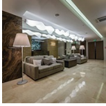
› MFC Capital City