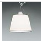
TOLOMEO SOSP/PTE DIFFUSORE RASO D.240 0781050A