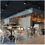
› Design Offices