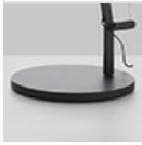
DEMETRA LED T BASE GRO 1733010A