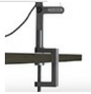
DEMETRA MORSETTO GRO 1744010A