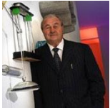
› Ernesto Gismondi