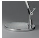
TOLOMEO BASE TV D230 VRN BCO A005320