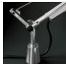
TOLOMEO SUPP.TAVOLO FISSO A004200