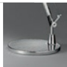
TOLOMEO BASE TV ALL D230 A004030