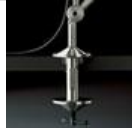
TOLOMEO MORSETTO A004100