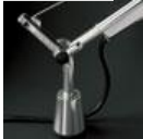
TOLOMEO SUPP.TAVOLO FISSO A004200