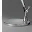
TOLOMEO BASE D 200 VERN BCO A008620