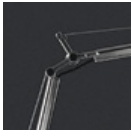
TOLOMEO TERRA SNODO A014000