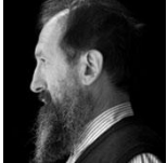
› Michele De Lucchi