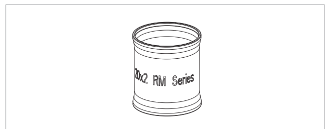
Caratteristiche delle bussole

Dettaglio bussola (rif.3 tab.2) - la scritta RM Series sta ad indicare che il raccordo può essere pressato con le pinze indicate in tabella 1.