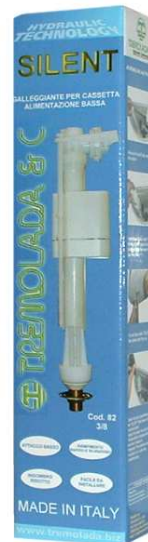
Art. 82 - Alimentazione bassa 3/8 3/8 Bottom float