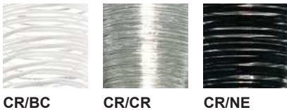
CR/BC CR/CR CR/NE