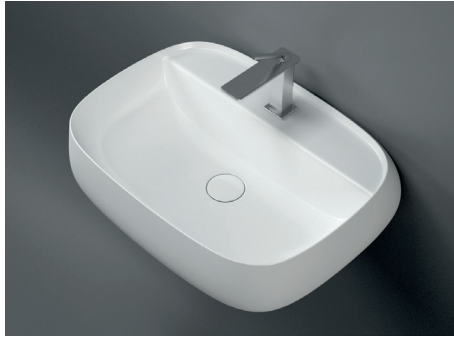
60 x 45 x h15