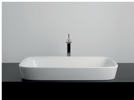
70 x 38 x h10