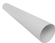
TUBO PVC D.100 L=700 (HRW 30) Codice 21879