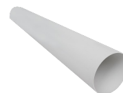
TUBO PVC D.100 L=700 (HRW 30) Codice 21879